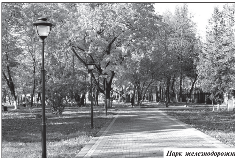
Парк железнодорожников преобразился.

— Парк теперь наше любимое место, — говорит молодая мама