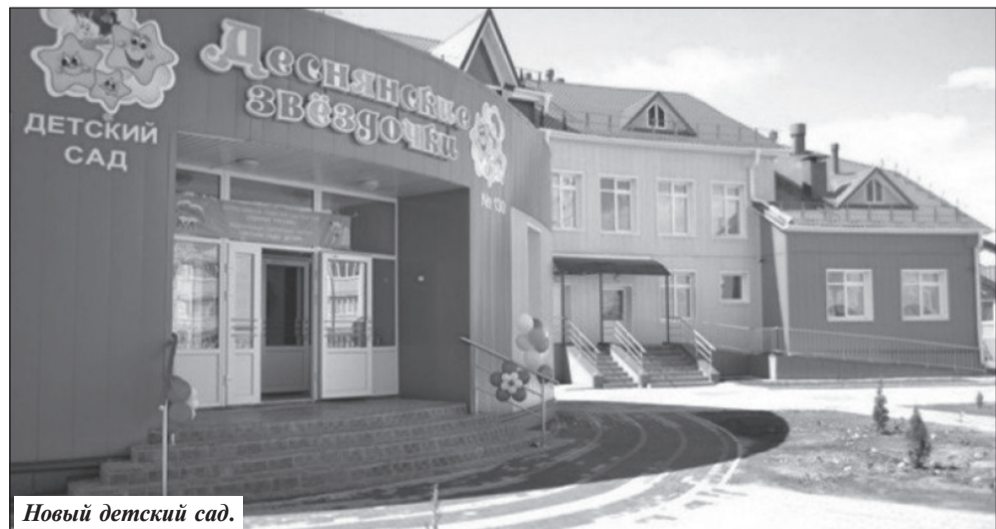
Новый детский сад.