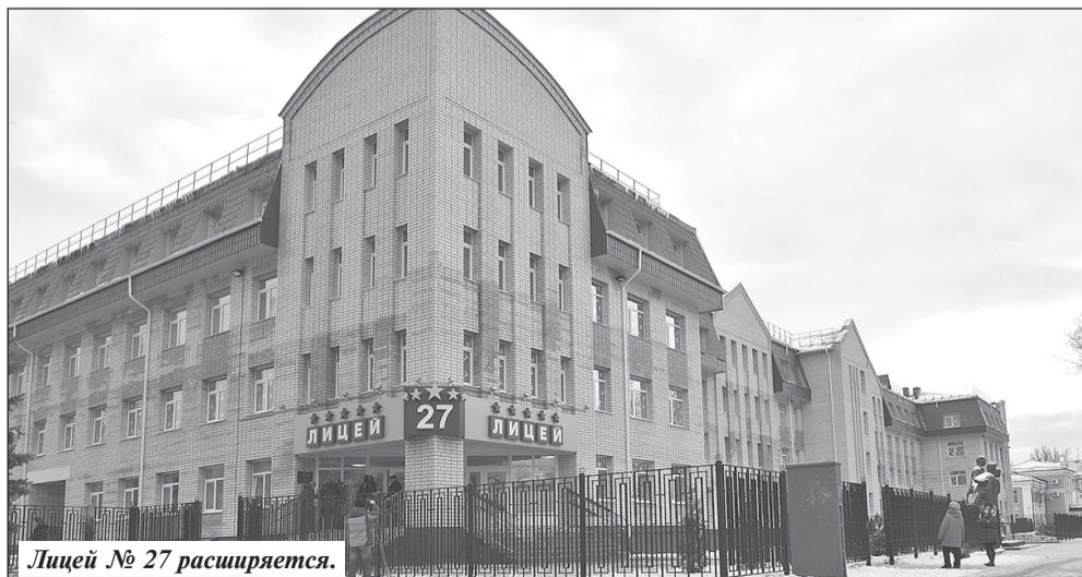
Лицей № 27 расширяется.