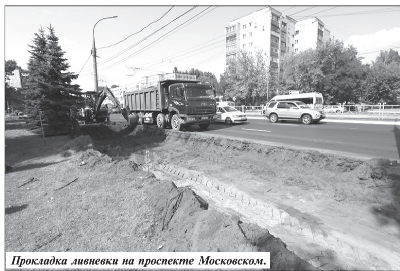
Прокладка ливневки на проспекте Московском.

— Теперь ждем бассейн, буду сына туда водить. Ездить до «Динамо» или в бассейн ДОСААФ не очень удобно. А спортом надо заниматься для здоровья и жизненного тонуса, — говорит